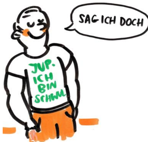
Judith Mail © bikablo