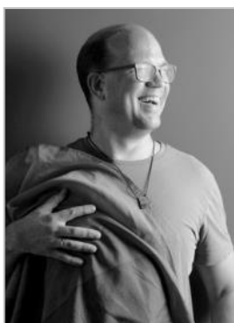
Frank Thies © Ich guck links

„Die Sichtbarkeit von Bisexualität und allgemein die Thematisierung von LSBTI* in der Schule ist unglaublich wichtig, damit junge Menschen wissen, dass sie nicht allein sind, dass sie zu einer vielfältigen, starken Gesellschaft gehören. Der Austausch beim dritten Regenbogenparlament war wertvoll und lässt hoffen, dass Lehrpersonen in Zukunft mehr aufklären und sich outen.“