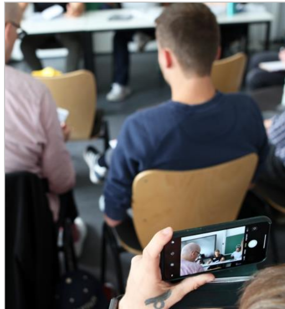
Fachforum 5

Das Fachforum griff die Ergebnisse der DJI-Studie auf und fragte, was die Betreiber*innen und Nutzer*innen sozialer Plattformen tun können, um für Respekt und Vielfalt im Netz einzutreten.