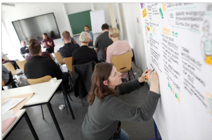
Fachforum 1

Die Arbeit von Jugendverbänden ist ein wichtiger Teil unserer pluralistischen Gesellschaft. In Pfadfinder*innen-Verbänden, beim Fußball, in politischen Jugendorganisationen, bei Migrant*innen-Selbstorganisationen oder auch bei der Freiwilligen Feuerwehr erfahren Kinder und Jugendliche ihre Sozialisation und sollen in ihrer Persönlichkeitsentwicklung gestärkt werden. Ein binäres Geschlechterverständnis und damit verbundene Rollenzuschreibungen schränken junge Menschen jedoch in ihrer selbstbestimmten Persönlichkeitsentfaltung ein und bilden einen Nährboden für homosexuellen-, trans*- und inter*feindliche Einstellungen. Innerhalb des Fachforums wurde diskutiert, wie es Jugendverbänden gelingen kann, die Vielfalt von unterschiedlichen Lebensweisen und Identitäten für ihre Arbeit zu nutzen, die eigene „Regenbogenkompetenz“ zu erhöhen und somit allen Kindern und Jugendlichen die Möglichkeit zu geben, sich frei und selbstbestimmt zu entwickeln.