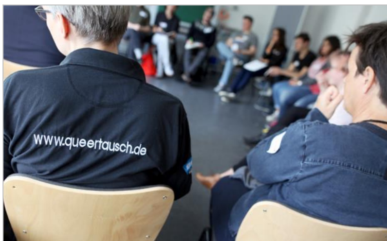
Fachforum 4

Die internationale Jugendarbeit ermöglicht es jungen Menschen, andere Länder und Kulturen kennen zu lernen, Vorurteile abzubauen und ihre vielfältige Persönlichkeit zu entwickeln. Damit gehört sie zum Kernbestand der Jugendarbeit. Gerade durch internationale Begegnungen wird ein gemeinsames Verständnis für vielfältige Lebensweisen und unterschiedliche politische sowie gesellschaftliche Sichtweisen vermittelt. Für junge Lesben, Schwule, Bisexuelle, Trans* und intergeschlechtliche Menschen sind internationale Austausch- und Begegnungsprogramme eine Möglichkeit, um aus ihrem konservativen, häufig auch homo- bzw. trans*-feindlichen Umfeld auszubrechen. Gleichfalls kann durch internationale Aktionen und Programme auch für die Akzeptanz von vielfältigen Identitäten und Lebensweisen im Ausland geworben werden. Gemeinsam mit den Teilnehmenden wurden im Fachforum neue Ansätze diskutiert, um die „Regenbogenkompetenz“ in der internationalen Jugendarbeit zu erhöhen und für ein menschenrechtsorientiertes globales Miteinander zu werben.