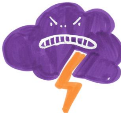
Judith Mehl @ bikedio

Auch er ist erstaunt, wie selten digitale Kompetenz und Wissen zum Thema in Unterricht und Jugendarbeit gemacht werden.