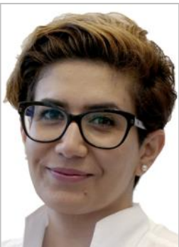
Hetav Tek © privat

„Die Fridays for Future“-Bewegung macht uns deutlich, dass wir auf die Straße gehen müssen, wenn etwas schief hängt“.