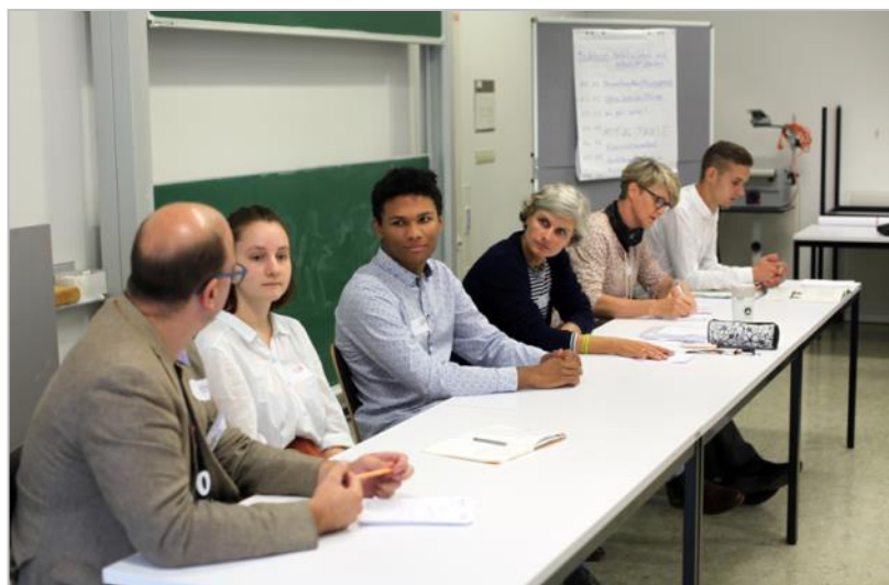
Fachforum 3

Aus ihrer Sicht wird das Thema recht positiv aufgenommen, vor allem in der Schüler*innenschaft. Auf der einen Seite gibt es heutzutage in nahezu jeder Jahrgangsstufe Menschen, die sich als queer identifizieren. Hier hat sich vor allem die Sichtbarkeit von jungen LSBTI* in Schulen erhöht. In Pausensituationen gibt es eher wenige Schwierigkeiten, wenngleich es auch immer wieder zu Diskriminierung und Mobbing kommt. Auf der anderen Seite kritisierten Jean und Tom, dass es an einem