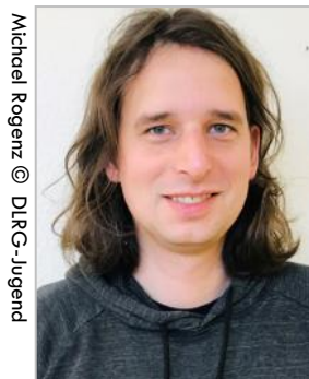
Michael Rogenz © DLRG-Jugend

„Kinder- und Jugendverbände sind zentrale Sozialisationsinstanzen und Bildungsorte einer pluralistischen Gesellschaft, denn dort verbringen viele Kinder und Jugendliche selbstbestimmt ihre Freizeit mit Freund*innen. Daher müssen Kinder- und Jugendverbände einen umfassenden Schutz vor Diskriminierung bieten, um allen Kindern und Jugendlichen die Möglichkeit zu geben, sich frei und selbstbestimmt zu entwickeln.“