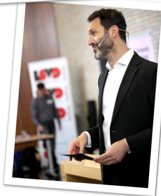
Alfonso Parisano