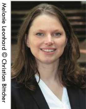
Melanie Leonhard

„Das Wirken des LSVD strahlt in die Jugendarbeit allgemein aus: zum Beispiel im Arbeitskreis der Bildungsreferent*innen in den Hamburger Jugendverbänden oder beim Fachtag ‚Diversitätsbewusste Jugendarbeit‘ der Fachberatung Jugendverbandsarbeit der Sozialbehörde.“