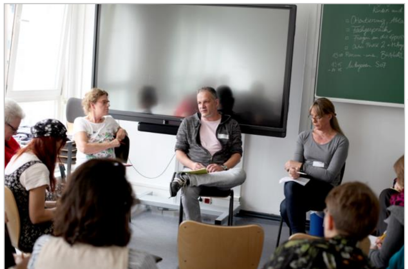
Fachforum 2

Kinder und Jugendliche sind in Ordnung, so wie sie sind. Trotzdem wird das Leben von trans* und gender-diversen Kindern und Jugendlichen oft sehr stark von der Angst vor negativen Reaktionen auf ihr Coming Out oder von alltäglichen Diskriminierungserfahrungen beeinflusst. Zusätzlich befinden sie sich in einer starken Abhängigkeit von Eltern und staatlichen Institutionen, was ihre persönliche Entwicklung nachhaltig prägt. Ob es nun darum geht, welche Kleidung sie anziehen, mit welchem Namen sie angesprochen werden wollen oder welche Umkleieräume sie nutzen wollen: immer sind Kinder und Jugendliche auf die Unterstützung von Erwachsenen angewiesen. Das Fachforum diskutierte, wie die bereits existierenden Angebote und Projekte der Kinder- und Jugendhilfe gestaltet werden können, um trans* und gender-diverse Kinder und Jugendliche in ihrer Entwicklung zu stärken und sie besser anzusprechen. Besondere Herausforderungen wurden besprochen und Beispiele guter Praxis vorgestellt.