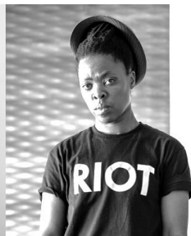
Zanele Muholi (Südafrika)